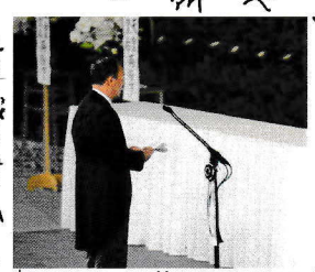
友人代表菅義偉氏の弔辞

友評と読む友人代表はA君にしようか?彼が先に逝ってしまったらどうし ようか?。色々心事を感じさせ、考えさせてくれた二つの国葬だった。