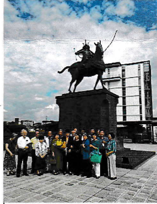
徳川家康像前のトリバード