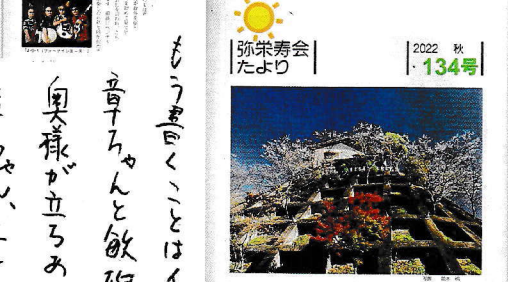
弥栄寿会 たより 2022 秋 134号

「たよりの表紙」 「たよりの表紙」は、毎月134号の「たより」に掲載されています。 「たよりの表紙」は、毎月134号の「たより」に掲載されています。