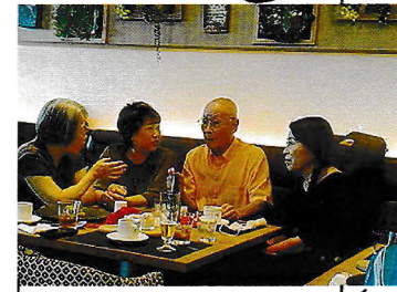
松井先生と級友の元好会