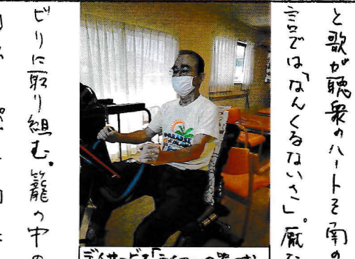
サイバーバイクの器

「たよりの表紙」 「たよりの表紙」は、毎月134号の「たより」に掲載されています。 「たよりの表紙」は、毎月134号の「たより」に掲載されています。