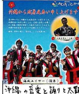
沖縄の音楽と踊りと大鼓

「たよりの表紙」 「たよりの表紙」は、毎月134号の「たより」に掲載されています。 「たよりの表紙」は、毎月134号の「たより」に掲載されています。