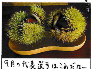
9月の代表選りはお餅だ

「たよりの表紙」 「たよりの表紙」は、毎月134号の「たより」に掲載されています。 「たよりの表紙」は、毎月134号の「たより」に掲載されています。